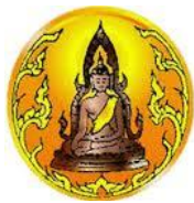
พิษณุโลก